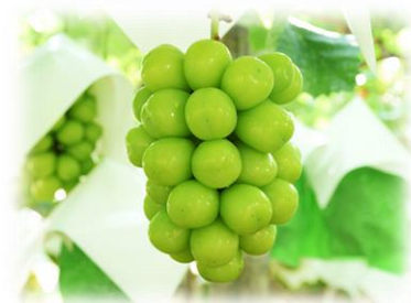
シャインマスカット